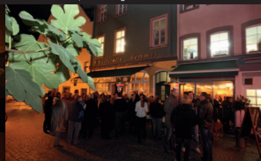
Auch „open air“ amüsierten sich die Gäste